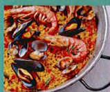
Paëlla de la mer